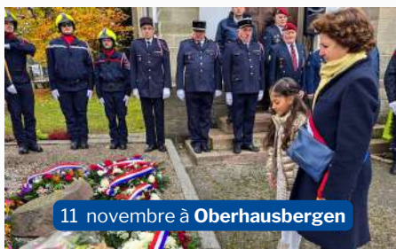
11 novembre à Oberhausbergen