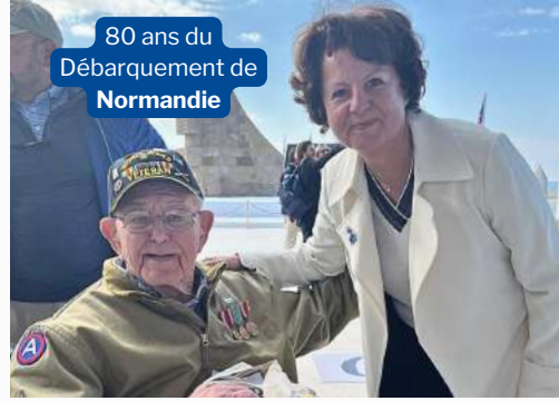
80 ans du Débarquement de Normandie