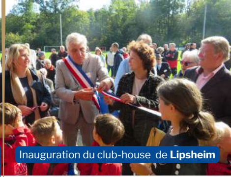
Inauguration du club-house de Lipsheim