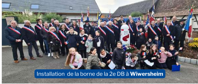
Installation de la borne de la 2e DB à Wiwersheim