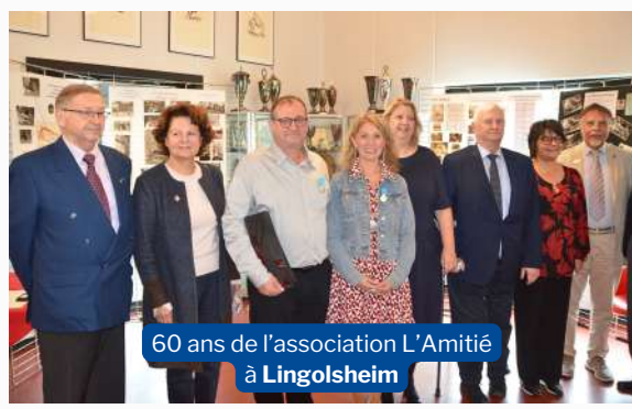
60 ans de l'association L'Amitié à Lingolsheim