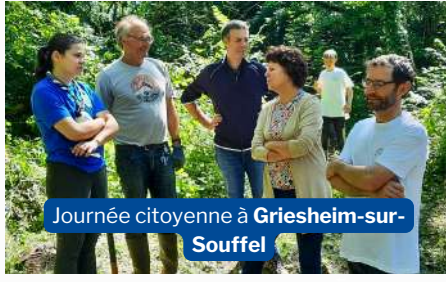
Journée citoyenne à Griesheim-sur-Souffel