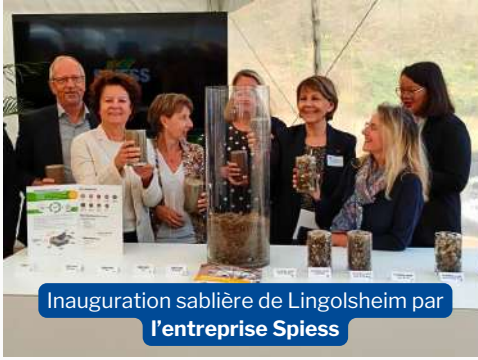
Inauguration sablière de Lingolsheim par l'entreprise Spiess