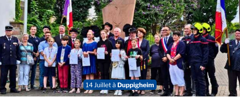
14 Juillet à Duppigheim