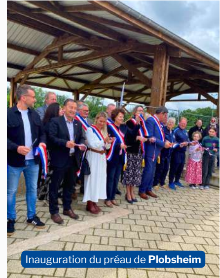
Inauguration du préau de Plobsheim