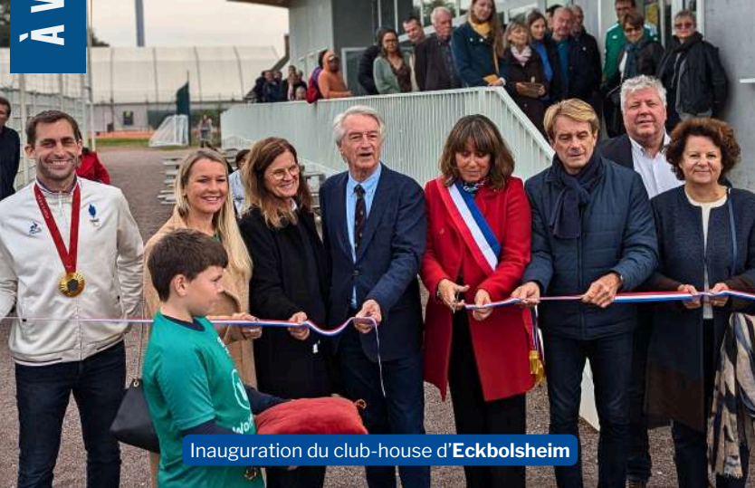
Inauguration du club-house d' Eckbolsheim