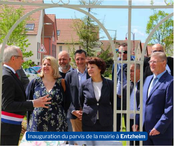
Inauguration du parvis de la mairie à Entzheim