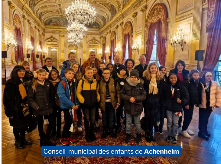
Conseil municipal des enfants de Achenheim