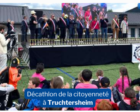
Décathlon de la citoyenneté à Truchtersheim