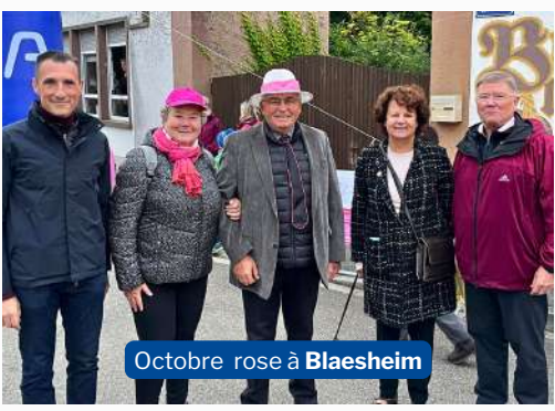
Octobre rose à Blaesheim